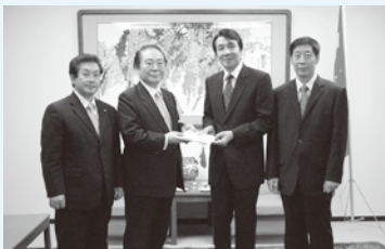
中国総領事館にて(6月24日)

5月16日~6月10日まで市民の皆さんなどから寄せられた募金827,870円を、長崎中国総領事館に届けました。さらに、玖島中学校生徒会から寄せられた募金23,620円も日本赤十字社長崎県支部に届けました。