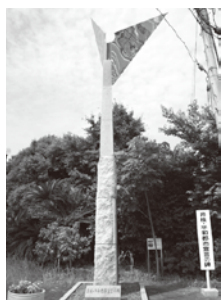
非核・平和都市宣言の碑