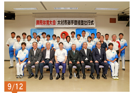
第73回国民体育大会「福井しあわせ元気国体」に出場された、大村市選手団の皆さん。