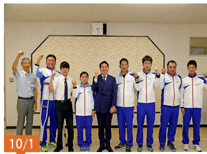
第18回全国障害者スポーツ大会「福井しあわせ元気大会」に出場された選手の皆さん。