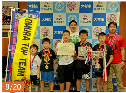
レスリングの第7回ジュニア玉名杯九州少年少女選手権(熊本県)で見事優勝された、OMURA TOP TEAMの選手の皆さん。