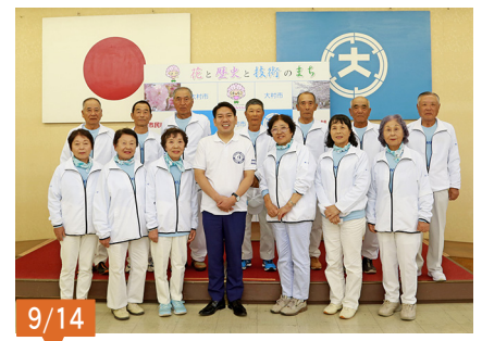
第73回国民体育大会「福井しあわせ元気国体」のグラウンド・ゴルフ公開競技に出場された選手の皆さん。