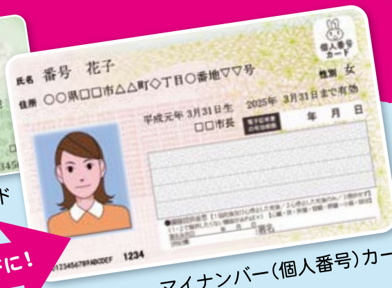
マイナンバー(個人番号)カード