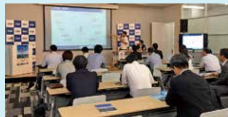
▲9月3日、都内で記者発表が行われました。

大村湾ZEKKEIライド2018の開催に合わせて、地域の魅力的な寄り道スポット情報を提供するスマートフォン無料アプリ「YORIP(ヨリリップ)」に新機能を追加しました。サイクリングコースや絶景スポット、走行情報などを地図上に提供するもので、大村湾ZEKKEIライドのイベントにリンクしています。イベント後もアプリのサービスは利用可能。皆さんのお出かけの手助けとして、ぜひ、ダウンロードしてみてください。(9月30日サービス開始)