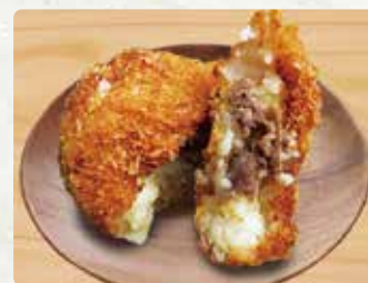
【ナガスイ】 愛のコロッケ(牛肉)/200円 鯛コロッケ/100円