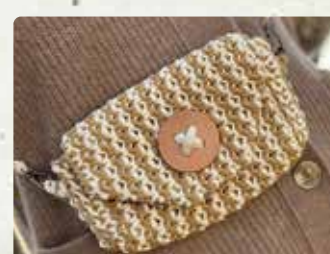
【豆八千】 皮革製品、マクラメ編製品/ 2000円~