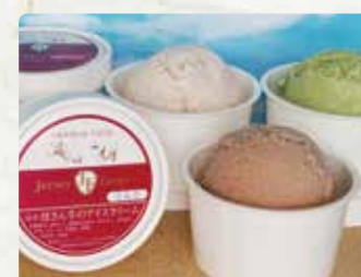
【ジャージーファーム】 カップソフト/300円、白玉ミルクゼンざい /400円、スープ/400円、ジェラート/400円