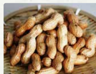
【浦川豆店】 塩ゆで落花生/500円 殻付き落花生/500円