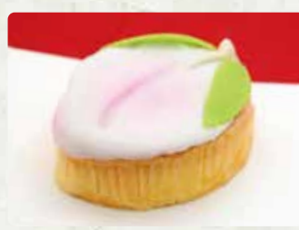
【万月堂】 桃カステラ/920円 マドレーヌ/260円