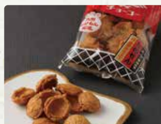
【オカシノフルカワ】 お菓子カップ詰め放題/400円、 チョコ醤油かめせん/290円