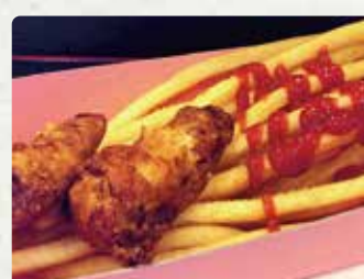
【ふく問屋なかさぎ】 ふくダシロングポテト/700円、ふくポテ トセット/1000円、ふく唐揚げ/600円