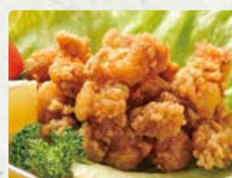
【からあげ大 長崎店】 中津唐揚げ(ミックス)/500円、砂ずりの唐揚 げ/350円、500円、ナンコツあられ/500円