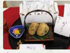
【お料理やまうえ】 大村鯛むすび/500円 【シュチュ】 長崎極ドレッシング