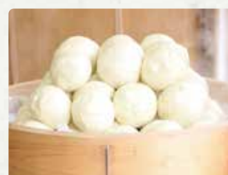
【ぶたまん人】 ぶたまん/90円、あんまん/90 円、蒸しパン/100円