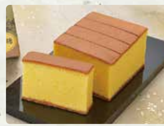
【琴海堂】 長崎和菓子三益かすてら/1080円、長崎その ぎ茶かすてら/1100円、切れ端/500円