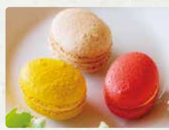
【エトワール】 マカロン/150円 焼き菓子/150円