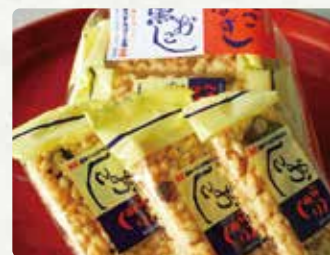
【兵児葉寿司おこし本舗】 黒おこし、ピーナツおこし、青 のり・ごまおこし/各450円