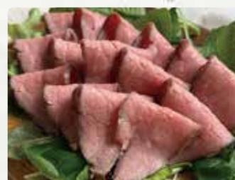
【ハッチロック hatch rock】 ローズビーフサンド/800円、ロースビーフ(普 通)/1100円、ロースビーフ(焼製)/1200円