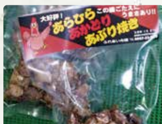
【小玉さんちの卵】 卵/400円 いなほ焼/370円