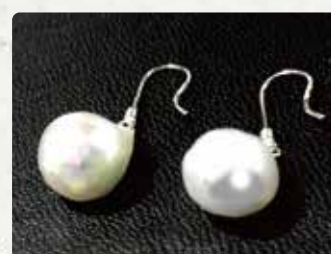
【松田真珠有限公司】 ピアス/9000円~、イヤリング/7000 円~、ペンダント/9000円~