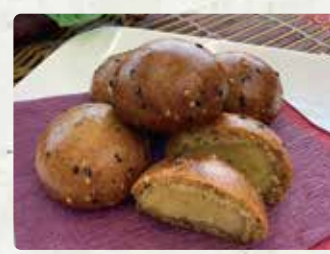
【菓子処かわた】 かりんとう万十/100円、赤飯 /300円、かす巻き/250円