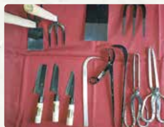
【竹田農具刀物製作所】 包丁/3000円~、鉄/1000円~、 鉄/4800円~、他