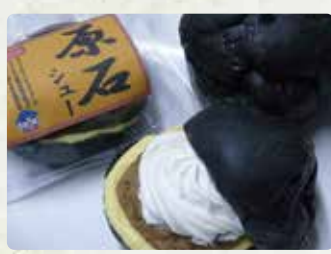
【KEIHO×Sanlemo】 原石シュー/350円 ピジュフィナンシェ/250円