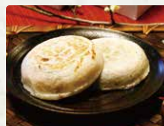
【梅ヶ枝荘】 大村寿司4角/820円 梅ヶ枝焼(5個入)/750円