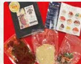
【Home ground】 長崎薬膳火鍋 雷の素/1300円