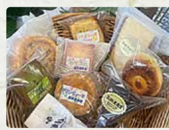
【高田進勇堂】 マドレーヌ/194円、満月/194円、 フィナンシェ/173円