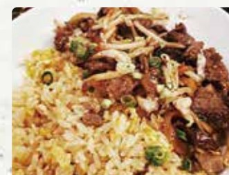
【飯屋・B】 豚大串焼(本)/1000円、鶏大串焼(本)/900円、牛カルビ チャーハン/600円、玉ねぎグリル/1個400円/箱入1400円