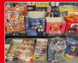
●オカシノフルカワ / お菓子詰め合わせ