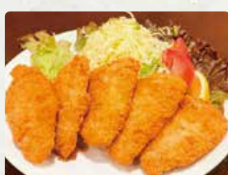
【バラモン食堂】 松浦アジフライ(半身大)1枚/250円 黒毛和牛メンチカツ/400円