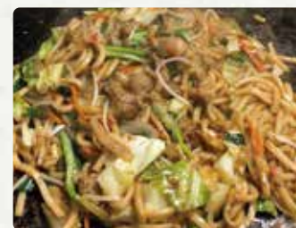
【とっと】 牛ホルモンうどんそば/600円、焼きそ そば/500円、フランクフルト/300円