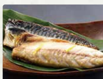
【丸富水産】 柚子鱈/500円、つぼ鯛/1500円、 銀ヒラスみりん/1200円~