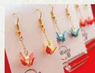
【和華wakra】 折鶴アクセサリー