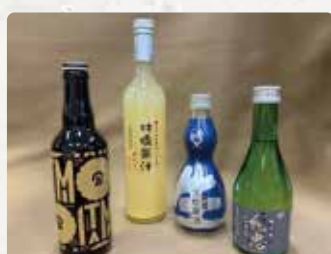
【大村市物産振興協会】*姉妹都市物産販売 秀よし/420円、KONISHI大吟醸ひやしほ り/550円、赤城高原林檎果汁/680円他