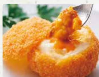
【天草 海まる】 うにコロッケプレミアム/430円、うにコロッケリ ゾット/430円、天草さび天ぷら1P/800円