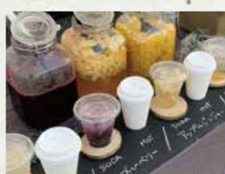
【喫茶のたね】 ホットレモン/400円