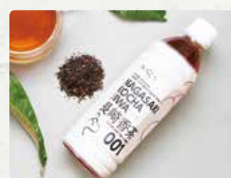
【茶葉々】 長崎香茶 びわ/200円