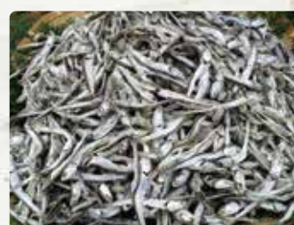
【森崎水産】 いりこ600g/1000円、一夜干 しあご1P/540円を2P600円