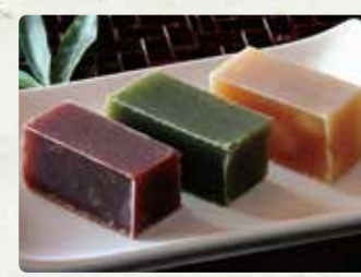
【増田の小城羊羹】 小城羊羹/756円、丸ぼうろ /756円、もなか/648円