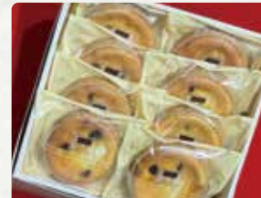
【TAKEMURA】 至高のベイクド・チーズケーキ福重巨 峰のラムレーズンを添えて/450円