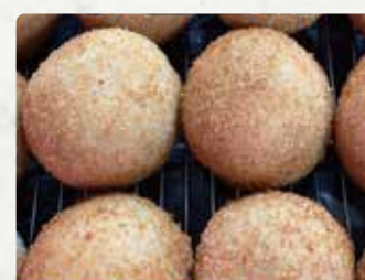
【長崎コロッケハウス】 コロッケチーズ/200円 ポテトスライド/300円