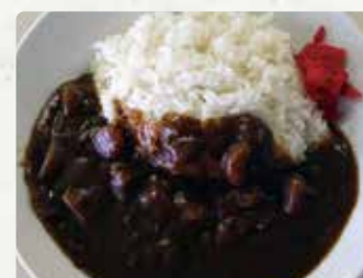
【陸・海自衛隊カレー(味美)】 陸・海自衛隊カレー/600円