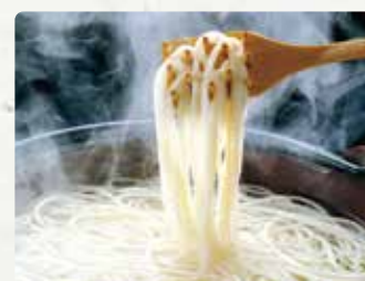
【五島手延べうどん協同組合】 五島うどん波の糸/480円、うどんお買い得セッ ト/5240円を3800円、かんころ餅/600円