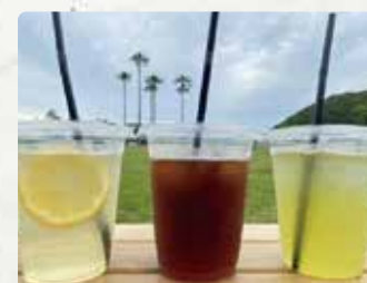
【OGT】 焼きそば/600円、ポテト/400 円、ドリンク/各300~500円