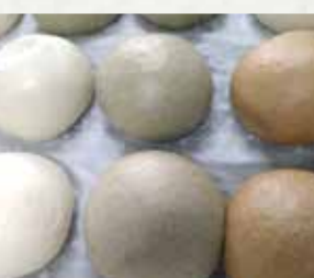
【西善製菓舗】 酒まんじゅう/100円、いきなりだ んご/100円、とらまき/600円