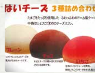
【洋菓子工房ピュイダムール 塩田津店】 ふんわりチーズ/1296円、はい チーズ/2430円、茶ちゃ丸/1250円