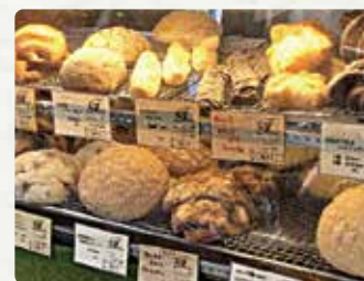
【Bakery Shop Fleur】 メロンパン/230円 ラスク/300円