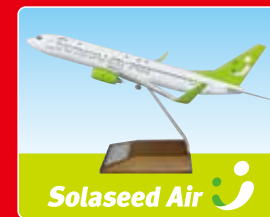
●ソラシドエア / モデルプレーン