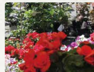
【浮羽園】 花・野菜苗/100円~ 花鉢/500円~