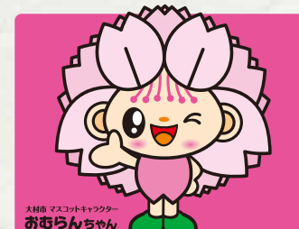
【おむらんちゃん】 おむらんグッズ販売