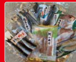
●ナガスイ / 海鮮一夜干セット