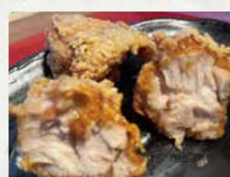
【からあげ味王】 鶏のから揚げ/600円