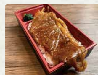
【肉バルにはち大村本店】 黒毛和牛ステーキ重/1380円、唐揚 げ/500円、ハリケーポテト/300円