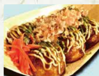
【ほっとりっく】 たこ焼き/600円