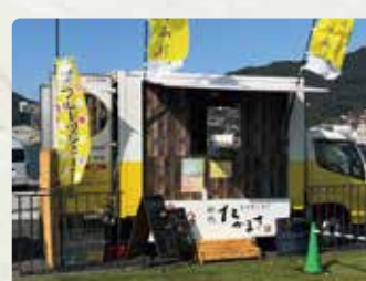
【長崎からあげ初代たかまさ】 長崎からあげ/600円 出島ロングポテト/700円