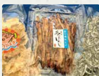
【玉木屋】 煮干し(小袋)/500円、チリメ ン1盛/400円、珍味/500円