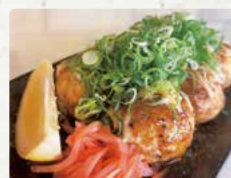
【やん蛸】 たこ焼き/600円