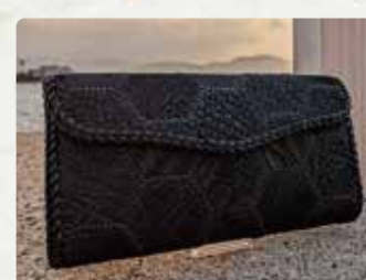
【銀職庵水主】 大村鯨革工芸、革の食器、皮 革製品/12000円~