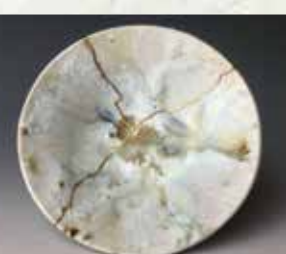
【五反林窯】 唐津焼/3000円~