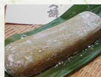
【川上元旦堂】 かんころ餅/700円