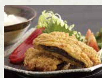
【鯨専門店 くらさき】 鯨カツ3枚/1080円 アジフライ3枚/1080円