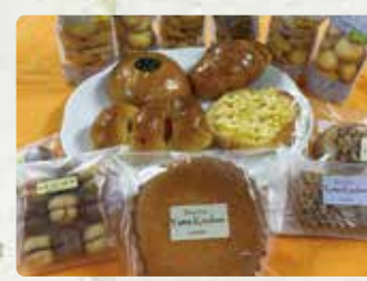
【ドリームパーク・ゆめ工房】 マドレーヌ/180円、クッキー /200円、ガトーショコラ/280円