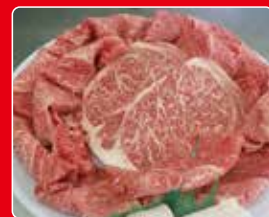
●長崎和牛

会場内で500円ご購入毎に抽選補助券1枚を進呈します。3枚で1回の抽選のチャンスになります!!