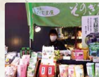
【長崎そのぎ茶たじま屋】 そのぎ茶/1100円、特上白折 /1100円、特上そのぎ茶/1100円