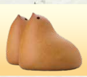
【ひよ子本舗吉野堂】 名菓ひよ子5角/837円、ひよ子サブLP5入 /573円、ひよ子ピュイダムール6入/767円