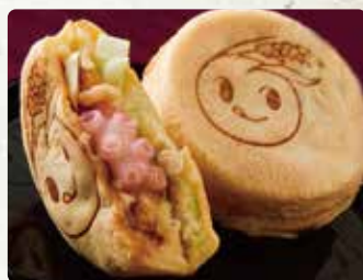
【ファーマーズ】 いなほ焼/120円 いなほ焼チーズ入/140円