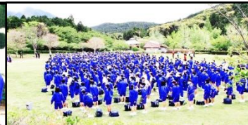
ロザモタ広場に郡中生徒全員集合！