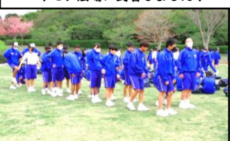
歓迎行事その1 ブロックの出し物