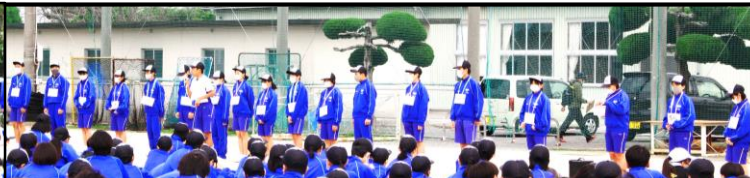
郡中グラウンドでの生徒会役員による出発式。感染予防に対する注意も行われました。