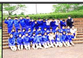
最後は、記念撮影です！