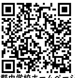
郡中学校ホームページ QRコード