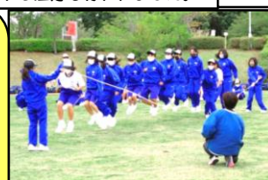
歓迎行事その3 長縄跳び競争