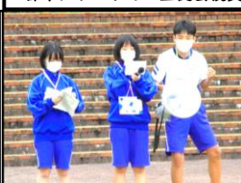
歓迎行事その2 クイズ