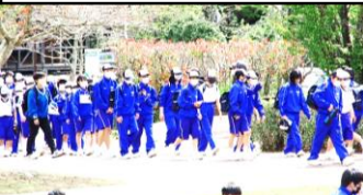
ロザモタ広場に到着しました！

コロナ禍の中、様々な学校行事の中止や制限が続いていましたが、前日の雨もすっかり晴れ渡り、郡中学校としては、3年ぶりとなる校外での歓迎遠足を4月15日（金）「野岳湖口ザモタ広場周辺」で実施することができました。感染予防に留意するため、マスクの着用や手指の消毒等、注意しなければいけない点は多々ありましたが、郡中学校の全生徒が一堂に集い、生徒会役員の生徒達が主体的に企画・運営する歓迎遠足は、何ものにも代えがたい教育活動であると改めて認識した次第でした。1年生歓迎行事も、ブロックごとの出し物や生徒会企画によるクイズ・長縄跳び競争等、たくさんの工夫が感じられ、嬉々とした表情で新しい仲間や先生方と共に、春の有意義な一日を過ごしていました。きっと、歓迎遠足に参加した生徒一人一人が令和4年度「チーム郡」の良き船出を体感した一日になったことでしょう。