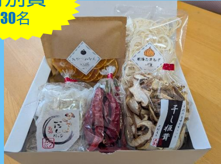
ドライフルーツドライ野菜詰め合わせ