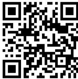
人権啓発動画 QRコード