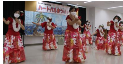
フラダンスや講座など