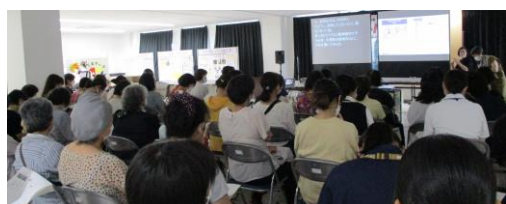
講話を真剣に聞き入る女性たち