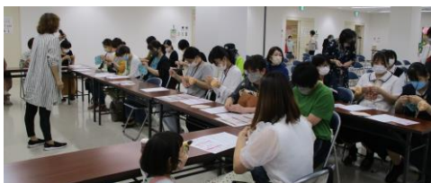
ワークショップ 布ナプキン製作