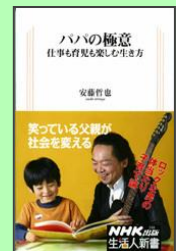
「パパの極意～仕事も育児も楽しむ生き方」 (安藤哲也)