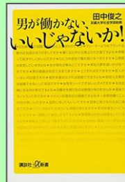
「男が働かない、いいじゃないか!」 (田中俊之)