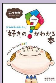
『「好き」の?がわかる本』