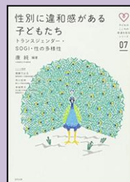
『性別に違和感がある子どもたち』