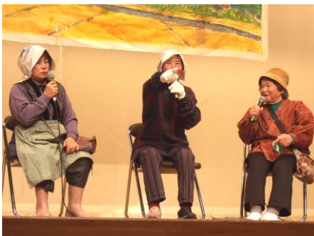
三婆ちゃんの軽快なやり取りに、会場は爆笑の渦でした！

参加者からは、「元気をいただいた」「参考になった」という感想をたくさんいただきました。