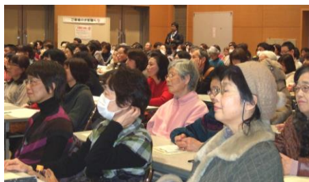
会場は大入り満員！