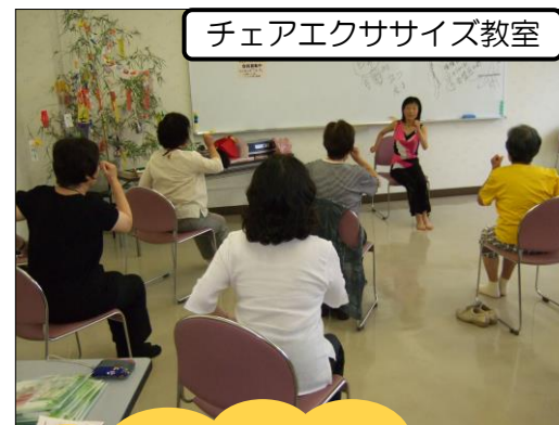
チェアエクササイズ教室

体に無理なくできるチェアエクササイズ！体幹を鍛える手軽な運動で、ほど良い汗をかきました♪