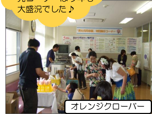
オレンジクローバー

オレンジクローバー（障害者施設ネットワーク協議会）の販売コーナーは今年も大盛況でした♪