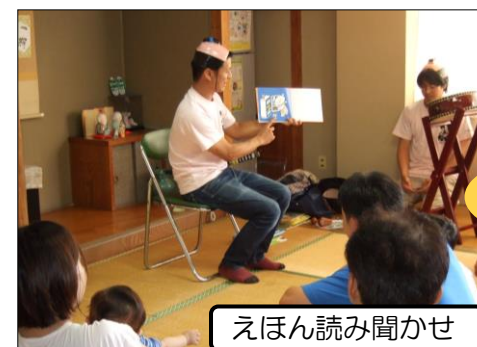
えほん読み聞かせ

ちょんまげ姿のえほん侍がやって来ました！太鼓の音で色々なシーンを演出！子どもたちが身を乗り出すほどの楽しい時間でした♪