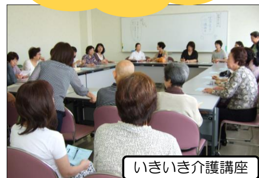
いきいき介護講座