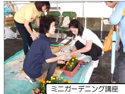
ミニガーデニング講座