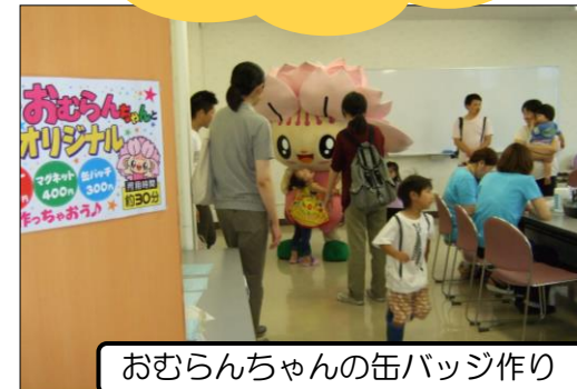
おむらんちゃんの缶バッジ作り