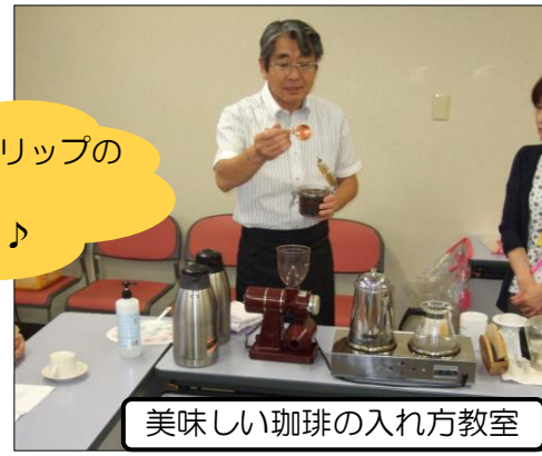
美味しい珈琲の入れ方教室

1杯目よりも2杯目♪と、ドリッパーの腕を磨きました(´▽`)v 珈琲の香りに癒されました～♪