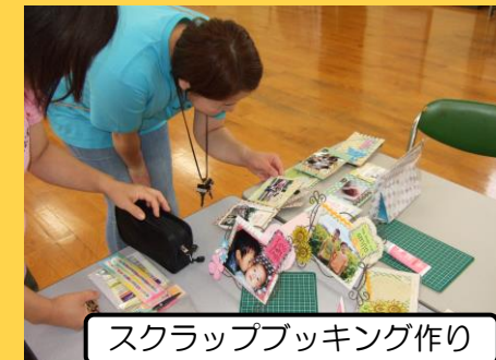
スクラップブック作り