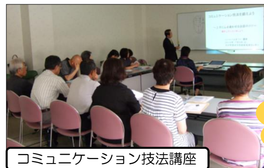
コミュニケーション技法講座