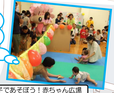
親子であそぼう！赤ちゃん広場

赤ちゃんたちが一等賞目指して頑張ったハイハイレース！おむらんちゃんの応援にちびっこたちは大興奮でした♪