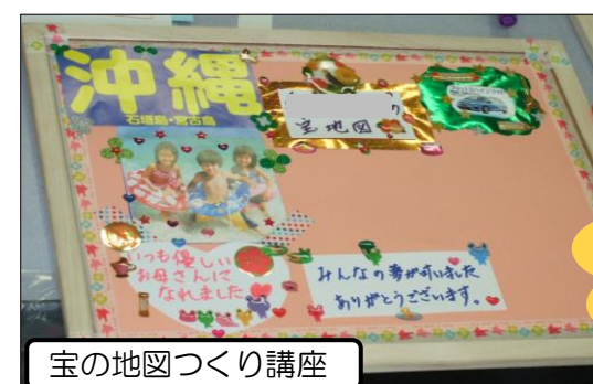
宝の地図づくり講座

《 連絡先・問合せ先 》 大村市男女共同参画推進センター「ハートパル」 〒856-0825 大村市西三城町8番地 総合福祉センター3階 TEL: 0957-54-8715 Fax: 0957-54-8700 Eメール: danjiyo-s@city.omura.lg.jp