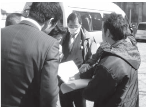
市民交流プラザ建設現場の調査を行う建設環境分科会

本町アパート及び市民交流プラザ整備事業における駐車場の確保状況、対策について質問。市側からは「旧駅前アパート跡地に整備される駐車場の利用状況、市民会館の駐車場の利用状況、県立図書館誘致の動向などを踏まえ、中心市街地エリアで駐車場確保を考えている。また、平成26年秋の供用開始までには、施設周辺に約50台駐車できる駐車場を確保するようになりたい」との答弁。