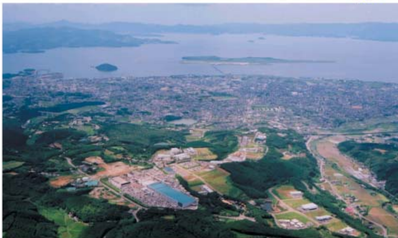
大村ハイテクパーク・オフィスパーク大村