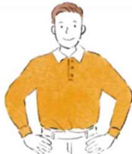
お手伝いしたい人